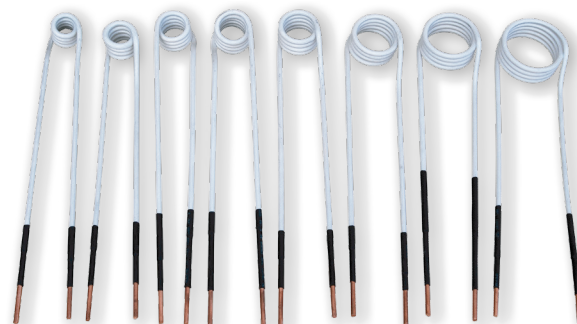
nasazovací boční cívky - rozměry viz tabulka