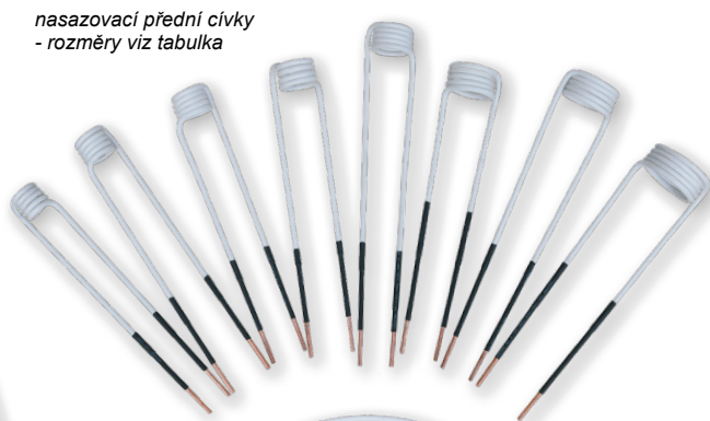
nasazovací přední cívky - rozměry viz tabulka