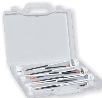
set 8 cívek 15-45 mm