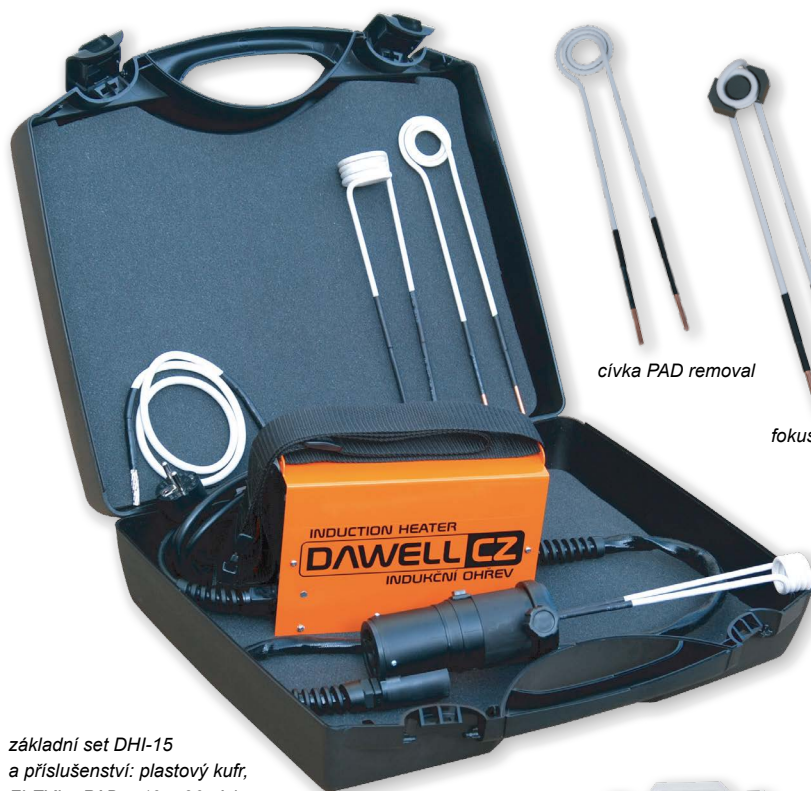
základní set DHI-15 a příslušenství: plastový kufr, FLEXI + PAD + 19 + 26 cívky

DHI-15 zahřeje šroub M12 nebo matici na teplotu 800°C do 15 vteřin. Příprava použití je podstatně rychlejší než příprava autogenní soupravy. Zapojením ohřevu do zásuvky 230 V, nasazením cívky na ohřívání díl a zmáčknutím ovládacího tlačítka ihned začíná proces indukčního ohřívání. Ohřívání díl je velmi rychle ohřátý dle potřeby až do „ruda“. Indukční cívky se dají snadno vyměnit za větší nebo menší rozměr, popřípadě kabel, který se omotá kolem dílu. K indukčnímu ohřevu je možné doobjednat sadu cívek různých průměrů.