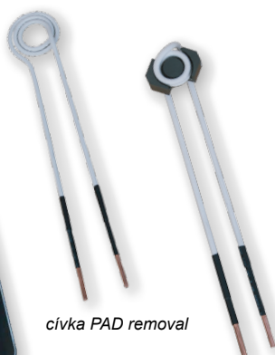
cívka PAD removal